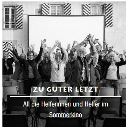
ZU GUTER LETZT

All die Helferinnen und Helfer im Sommerkino